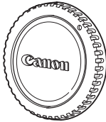
غطاء الجسم (ص 33)